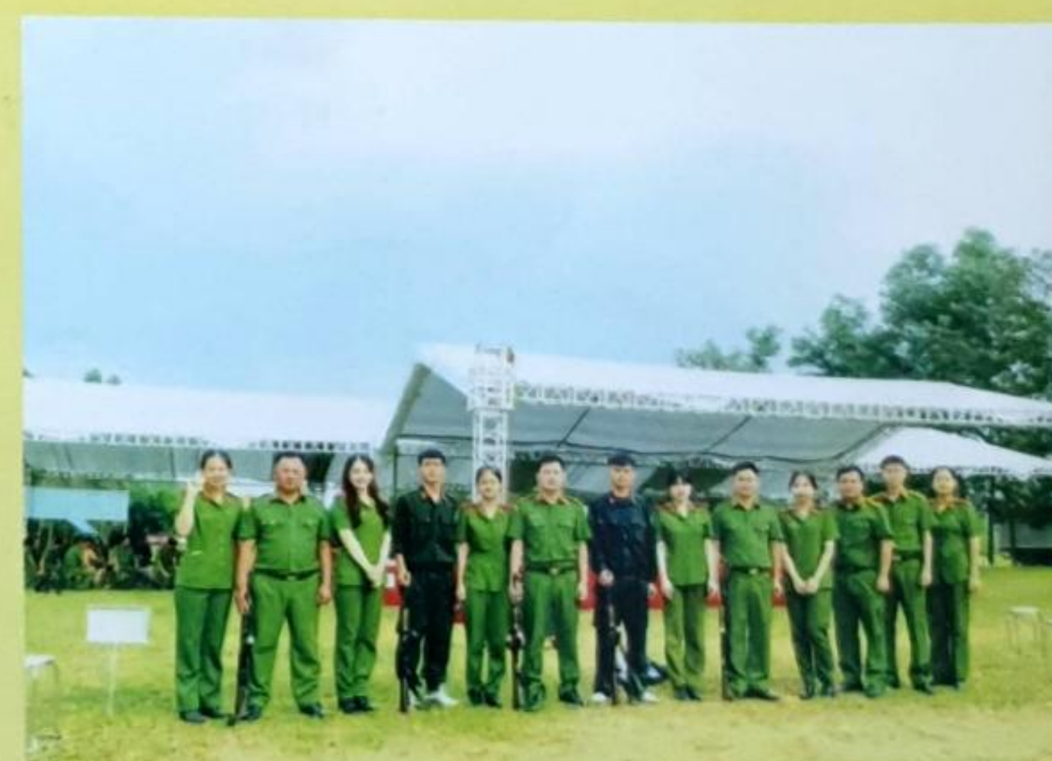
Đội tuyển bắn súng của Học viện CSND chụp ảnh lưu niệm tại trường bắn (Tuyên Quang)