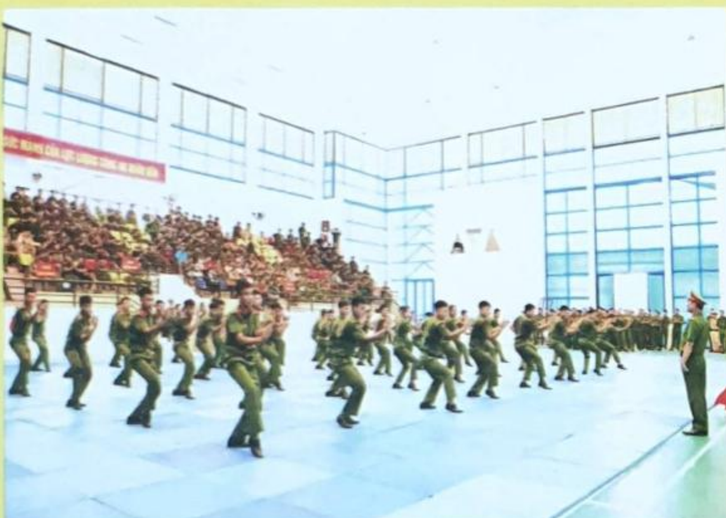
Bài thi biểu diễn võ thuật của Đội tuyển Học viện CSND