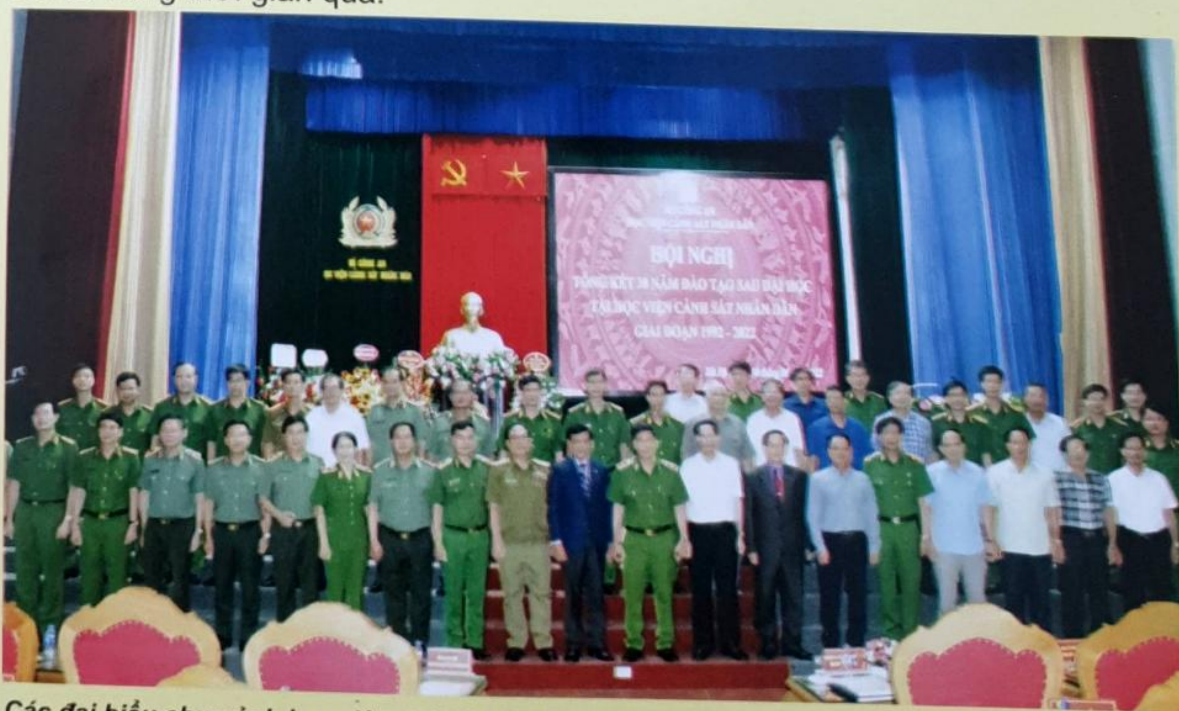
Các đại biểu chụp ảnh lưu niệm tại Hội nghị