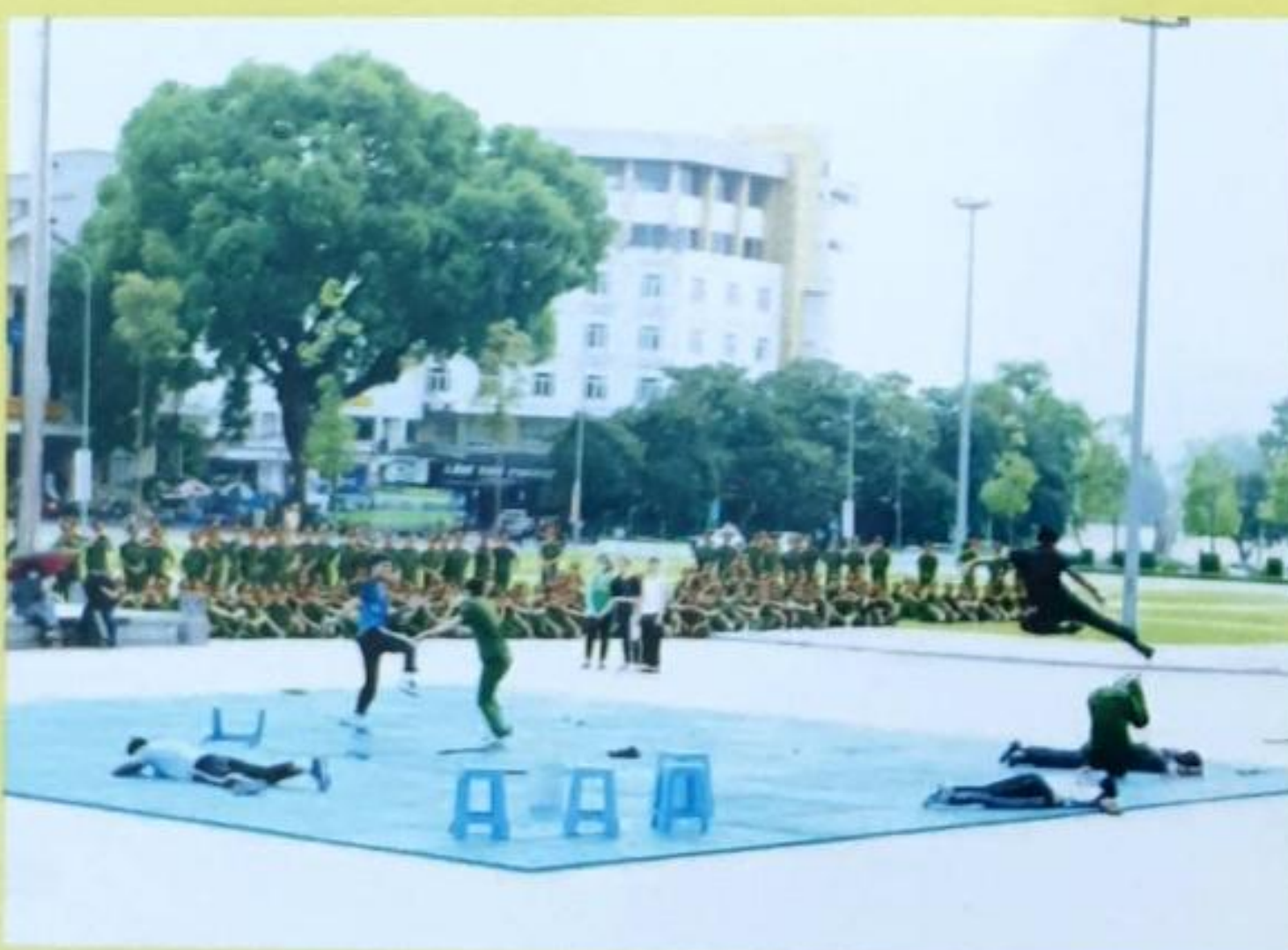
Phần thi tình huống của Đội tuyển Học viện CSND