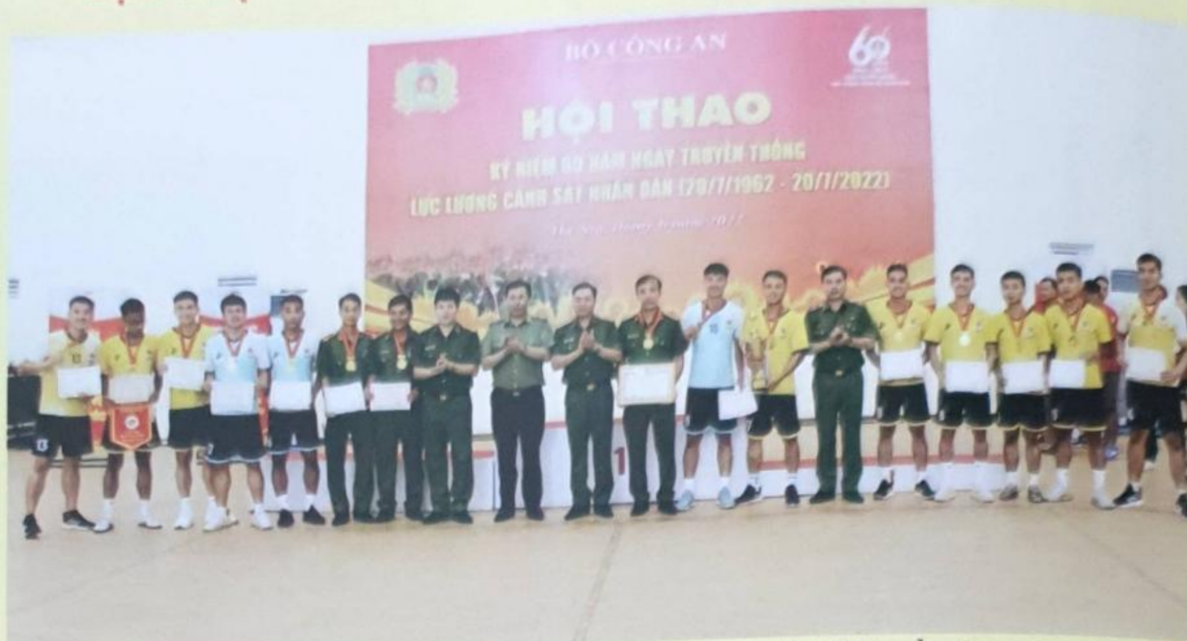
Đại diện Ban Tổ chức Hội thao trao giải bóng đá nam cho các đội tuyển tham dự tại buổi Bế mạc: giải Nhất (T02); giải Nhì (T06); đồng giải Ba (T09 và K02)

Sau 06 ngày thi đấu sôi nổi tại Học viện CSND, Hội thao đã thành công tốt đẹp, để lại nhiều ấn tượng tốt đối với các đoàn vận động viên, cổ động viên. Học viện CSND đã đảm bảo mọi điều kiện tốt nhất về cơ sở vật chất, bố trí nhân lực, vật lực cần thiết, đóng góp tích cực và thành công của Hội thao.