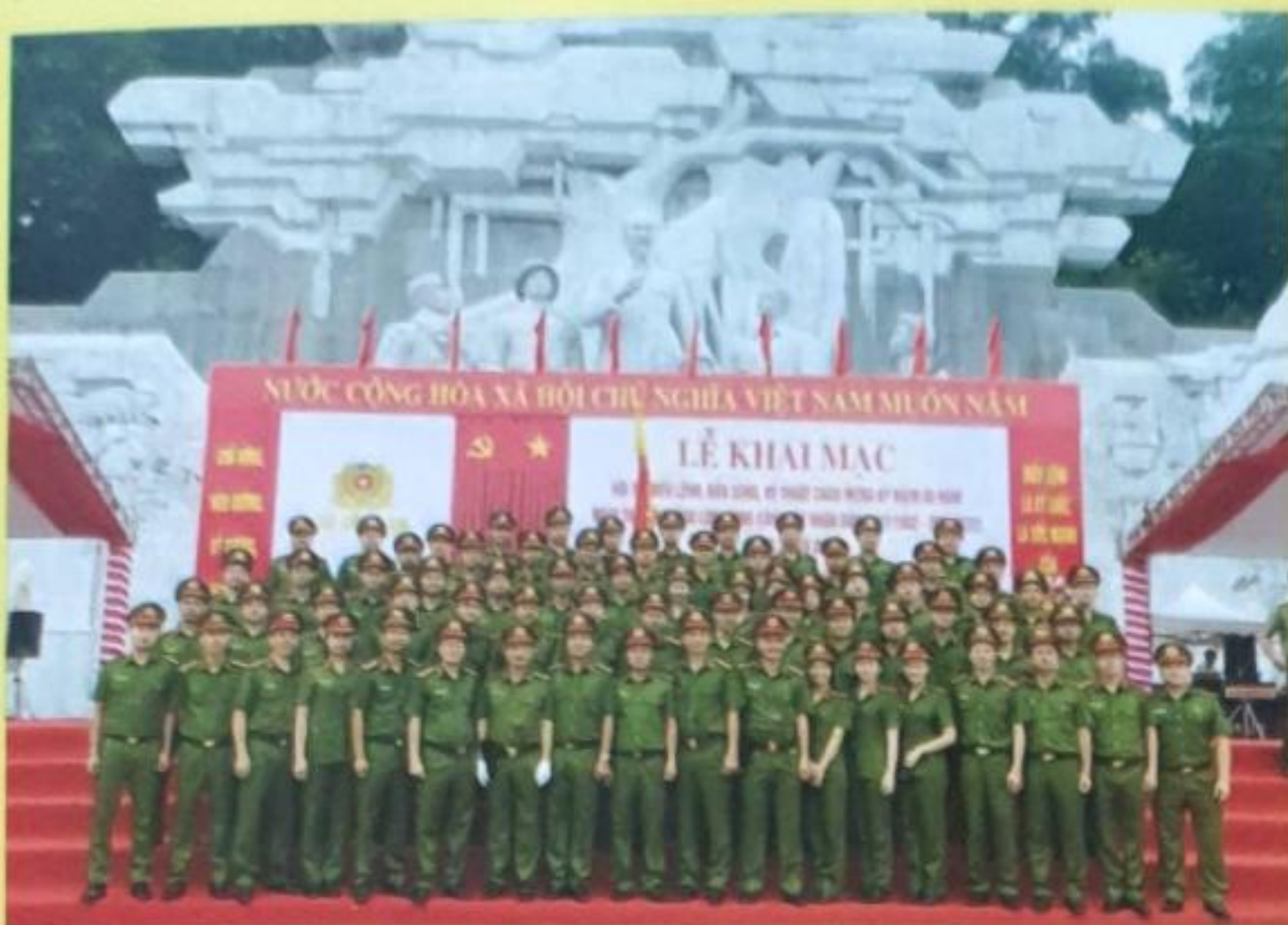
Đội tuyển Học viện CSND chụp ảnh lưu niệm tại Lễ Khai mạc Hội thi