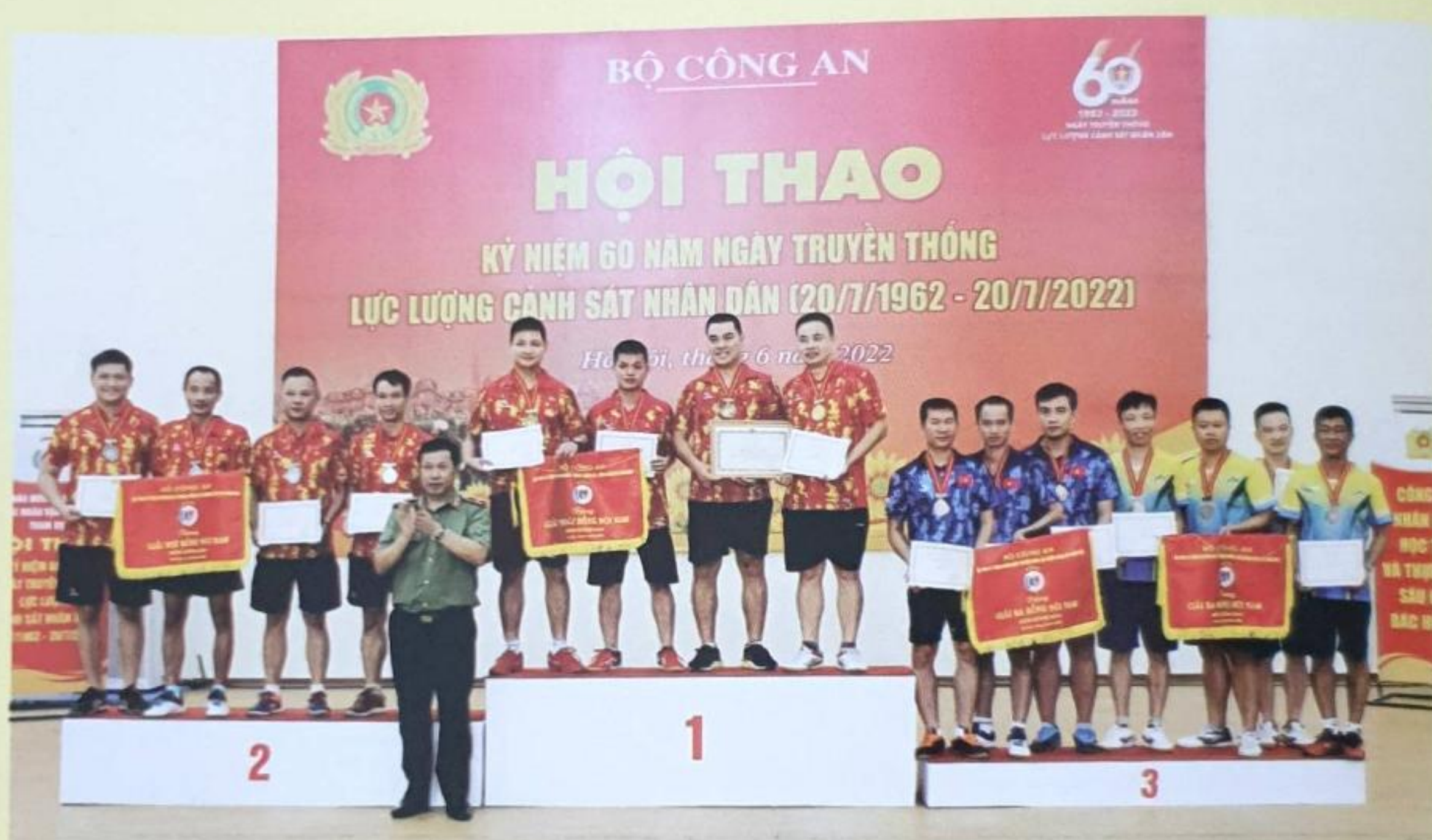
Đại diện Ban Tổ chức Hội thao trao giải Đồng đội nam môn bóng bàn cho các đội tuyển tham dự tại buổi Bế mạc: giải Nhất (T02); giải Nhì (CATP Hà Nội); đồng giải Ba (CATP Hải Phòng và CAT Phú Thọ)

Đoàn huấn luyện viên, vận động viên Học viện tham gia Hội thao đã tích cực tập luyện, thi đấu hết mình, đạt thành tích cao tại các môn thi đấu. Cụ thể như sau: