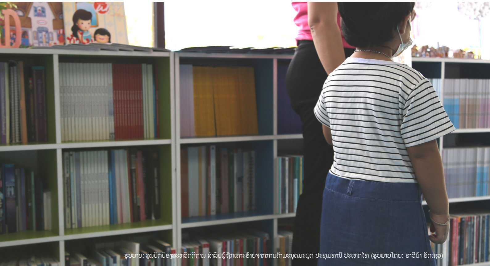
ຮູບພາບ: ສູນປົກປ້ອງສະຫວັດດີການ ສຳລັບຜູ້ຖືກເຄາະຮ້າຍຈາກການຄ້າມະນຸດມະນຸດ ປະທຸມທານີ ປະເທດໄທ (ຮູບພາບໂດຍ: ຣາວິນ້າ ຣັດເຊວ)

ອົງການຍຸຕິທຳສາກົນ ແລະ ກົມພັດທະນາສະຫວັດດີການ ແລະ ການພັດທະນາ ຂອງຟີລິບປິນ (DSWD) ກຳລັງ ຮ່ວມມືກັນ ເພື່ອພັດທະນາ ຮູບແບບການເບິ່ງແຍງຜູ້ຖືກ ເຄາະຮ້າຍຈາກການຖືກລ່ວງລະເມີດທາງເພດ ແລະ ຊຸດອິດ ທາງເພດເດັກທາງອອນລາຍ (OSAEC). ຟີລິບປິນ ໄດ້ຮັບ ການກຳນົດວ່າເປັນປະເທດຕົ້ນທາງຫຼັກ ສຳລັບ OSAEC ແລະ ການແຜ່ລະບາດ COVID-19 ເຮັດໃຫ້ແນວໂນ້ມນີ້ ເພີ່ມຂຶ້ນຢ່າງຮຸນແຮງ.[22] ຮູບແບບການເບິ່ງແຍງ ທີ່ເນັ້ນ ໃສ່ຜູ້ຖືກເຄາະຮ້າຍ ໄວໜຸ່ມ ແລະ ພີ່ນ້ອງທີ່ແຕກຕ່າງກັນ/ ເພດທີ່ແຕກຕ່າງກັນ ໂດຍແກ້ໄຂ ການຄາດແຄນສູນພັກ ເຊົາທີ່ມີຢູ່ ໃນຟີລິບປິນ ໃຫ້ສາມາດຮັບຮອງເອົາກຸ່ມຄົນເພດ ຕ່າງໆໄດ້.